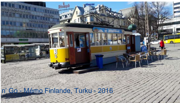
Ap n' Go - Mémo Finlande, Turku - 2016