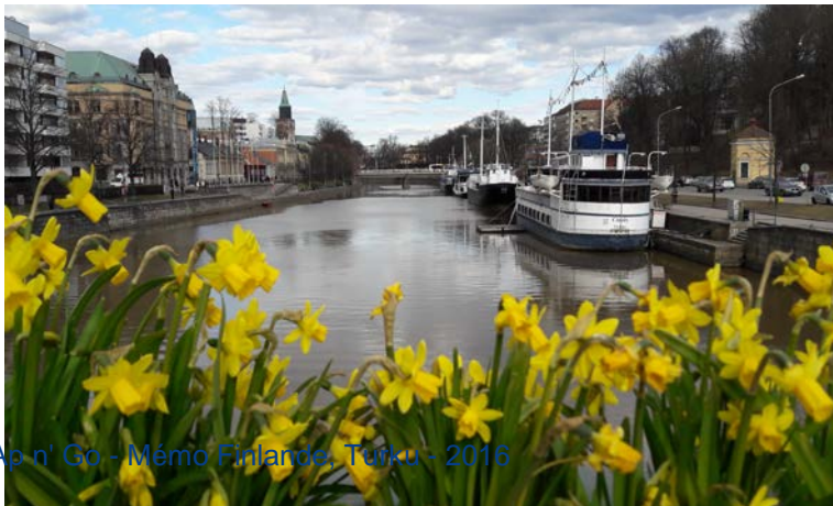
Ap'n' Go - Mémo Finlande, Turku - 2016

Nota : Le terminal de bus de Turku est situé à côté de l'hôtel B&B Tuure.