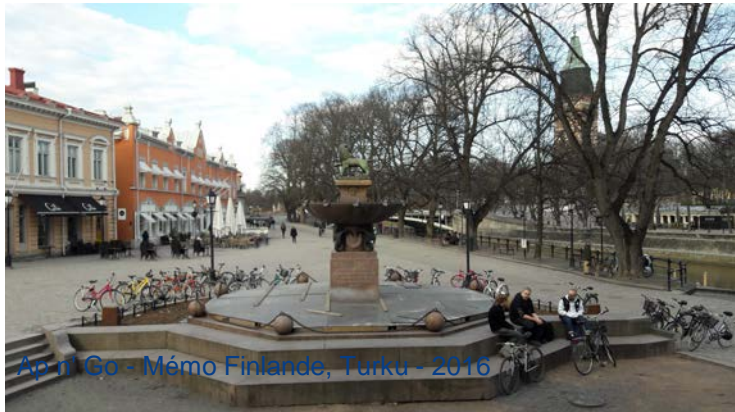
Ap n Go - Mémo Finlande, Turku - 2016

nota : la ville de Turku a possède plusieurs restaurants gastronomiques.